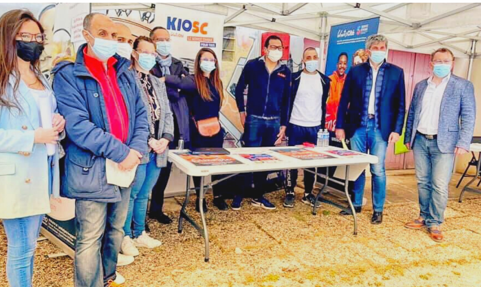
Image : L'équipe KIOSC présente au Forum Flash Emploi le 05 Mai 2021 aux Près-Saint-Jean avec 19 autres partenaires